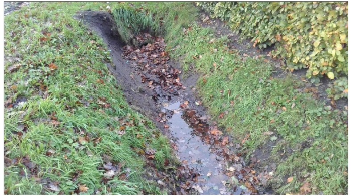
Foto 3 - Schadedetail