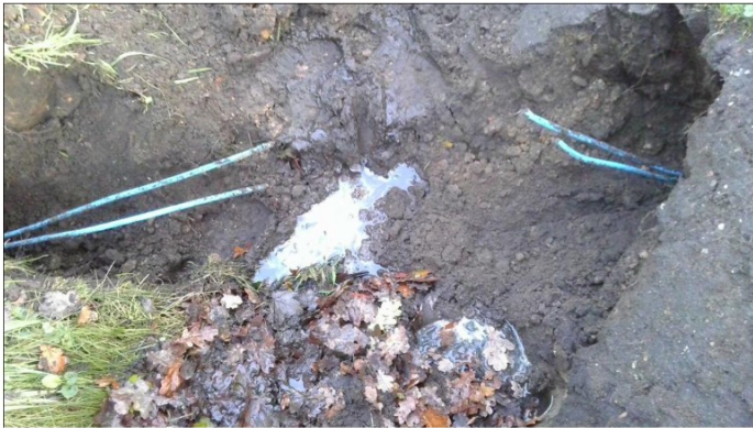
Foto 4 - Na reparatie