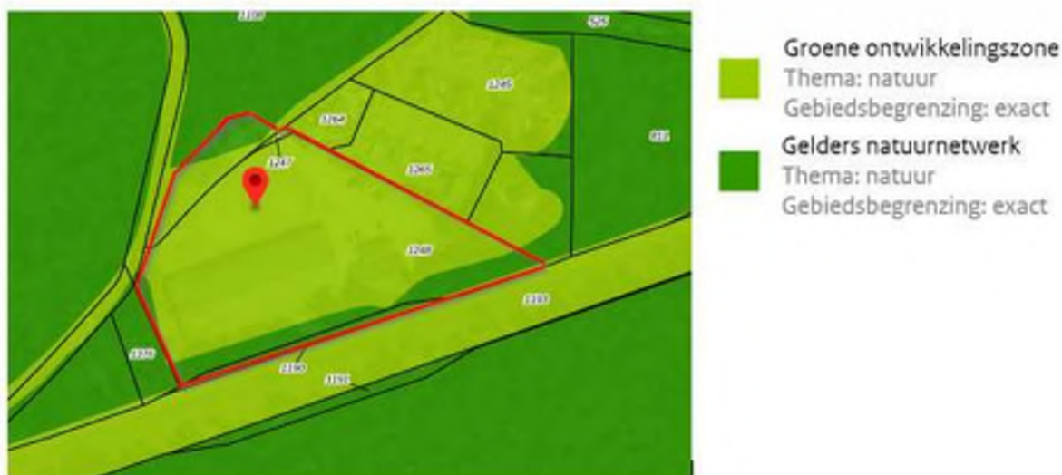
Uitsnede kaart 'Regels Natuur' (bron: ruimtelijkeplannen.nl)

Navolgende afbeelding toont een uitsnede van de kaart 'Regels Natuur - kaart 1' behorende bij de Omgevingsverordening. Hierop is te zien dat het plangebied gelegen is in zones die zijn aangeduid als Groene ontwikkelingszone (GO) en Gelders natuurnetwerk (GNN). Op de gronden binnen GO vinden geen wijzigingen plaats en dus zijn hiervoor geen relevante regels van toepassing. Het te herbestemmen gebied is gelegen binnen GNN.