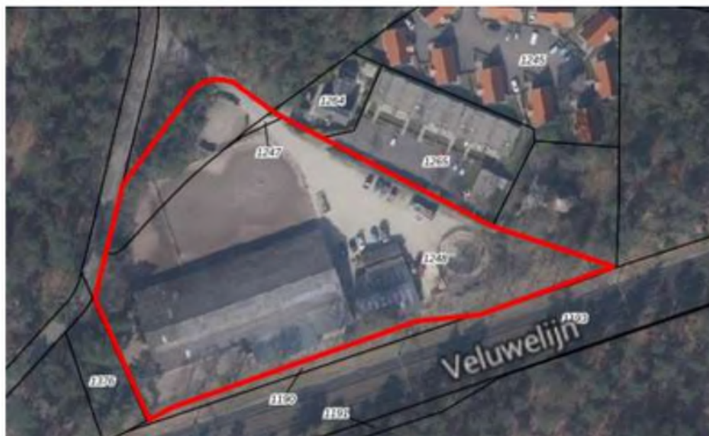
Luchtfoto plangebied

Aan de Belvédèrelaan 24 te Nunspeet is een manege gevestigd. Het plangebied is gelegen in een bosrijk gebied met in de omgeving enkele woningen en een recreatiepark. Ten zuiden van het plangebied loopt een spoorlijn. Binnen het plangebied bevinden zich onder meer een overdekte hal, een paardenbak en een parkeerterrein. Een gedeelte van het terrein dat in gebruik is bij deze manege (circa 150 m 2 ) is momenteel in bezit van de gemeente Nunspeet. Op deze gronden bevindt zich een longercirkel. Het plangebied wordt met een inrit ontsloten via de Belvédèrelaan. Parkeren vindt op eigen terrein plaats.