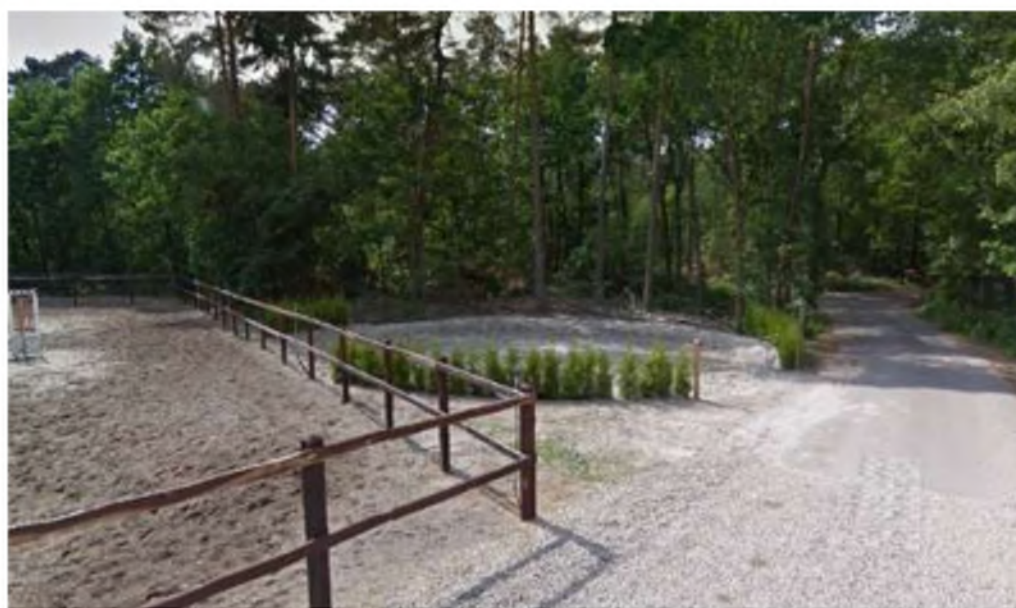
Aanzicht longercirkel vanaf Belvédèrelaan