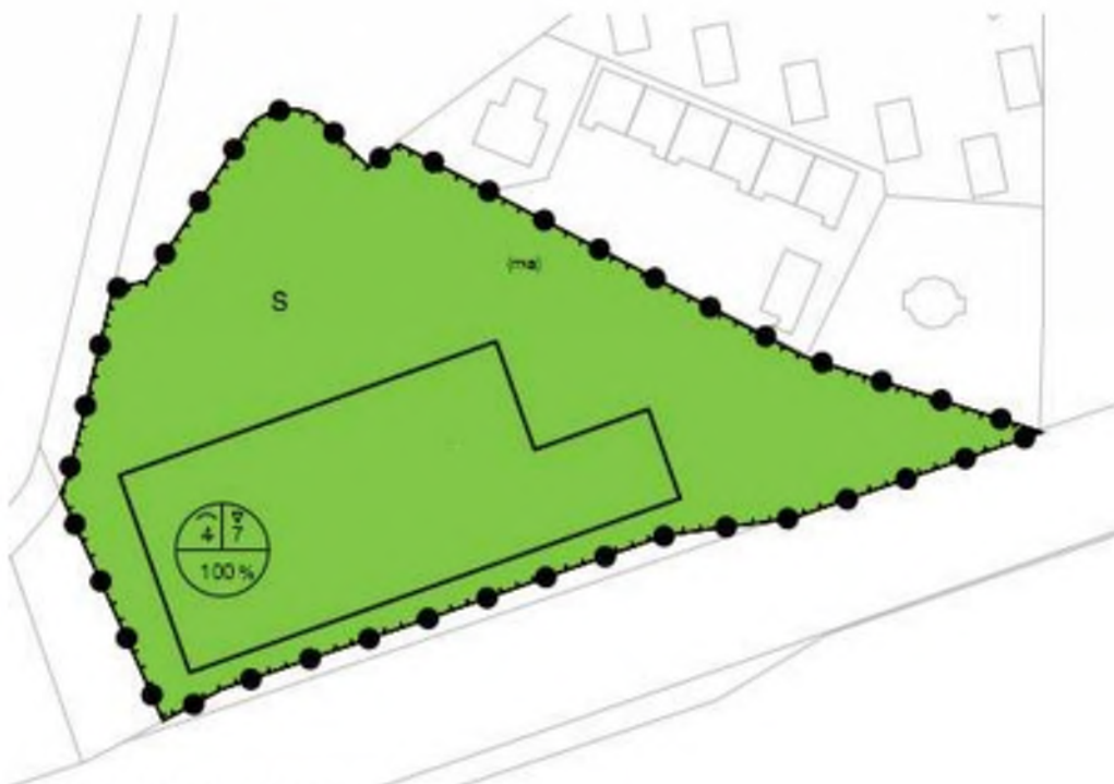
Uitsnede verbeelding voorliggend bestemmingsplan

Met voorliggend plan wordt een deel van de gronden grenzend aan de noordzijde van de manege op het perceel Belvédèrelaan 24 in Nunspeet planologisch-juridisch bij het perceel betrokken en omgezet naar de bestemming 'Sport'. Deze gronden zijn in de huidige situatie al in gebruik door de manege. Met het plan vinden verder geen ruimtelijke wijzigingen plaats. Het plan voorziet alleen in het toekennen van een bestemming die passend is bij de bestaande situatie en het feitelijk gebruik van de grond. De ontsluiting van het perceel wijzigt niet en het parkeren blijft, net als in de huidige situatie, plaatsvinden op eigen terrein. De navolgende afbeelding toont een uitsnede van de verbeelding van voorliggend bestemmingsplan.