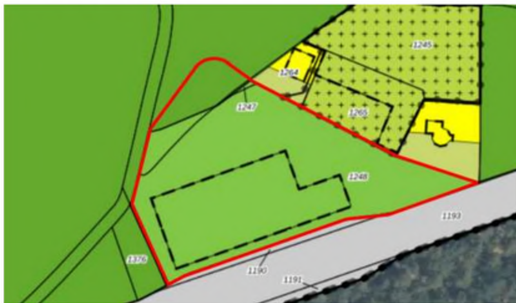
Uitsnede vigerend bestemmingsplan

Het noordelijk deel van het plangebied kent de bestemming 'Bos'. De gronden met deze bestemming zijn onder meer bestemd voor houtproductie, instandhouding en ontwikkeling van bos en extensieve openluchtrecreatie. Navolgende afbeelding toont een uitsnede van het vigerende bestemmingsplan.