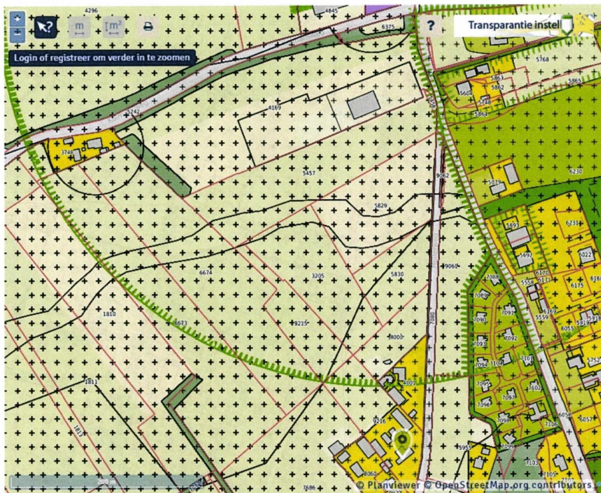
Molencirkele – Molen de Duif