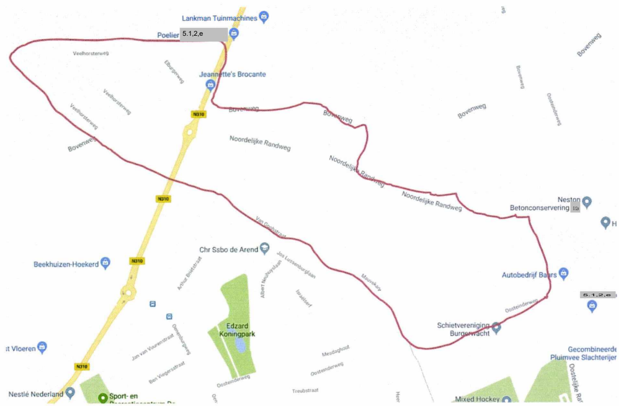
Nunspeet Noord-Oost III