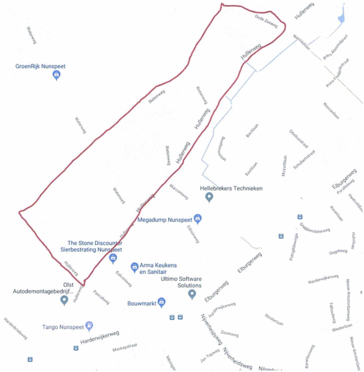
Nunspeet- Noord-West II