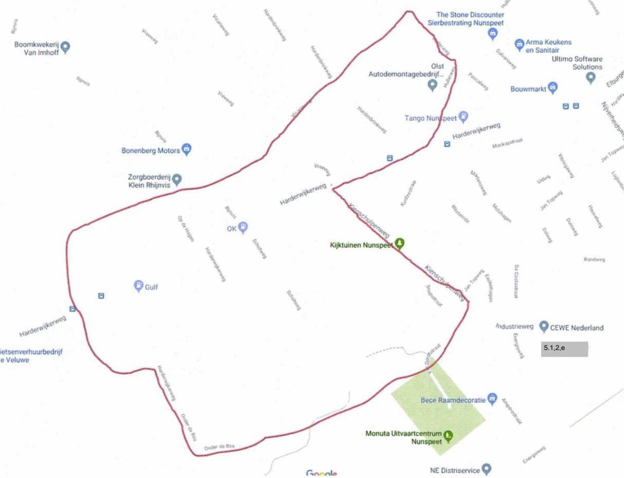
Nunspeet- West I