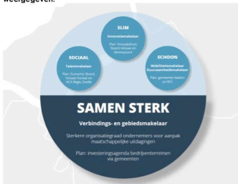
Figuur: Ondersteuning + 'bundeling inzet overheid' gericht op bedrijventerrein

In de Noord-Veluwe investeringsagenda toekomstbestendige bedrijventerreinen is de verwevenheid weergegeven.