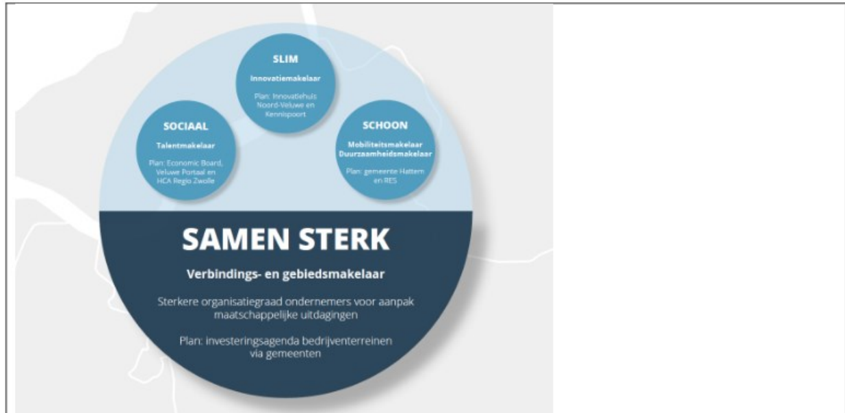
Figuur: Ondersteuning + 'bundeling inzet overheid' gericht op bedrijventerrein

Op de Noord-Veluwe en ook voor De Kolk en Feithenhof zijn voor de ambities Slim/innovatie en Schoon/mobiliteit al makelaars aan de slag. De plannen voor Sociaal/talentmakelaar zijn in een vergevorderd stadium.