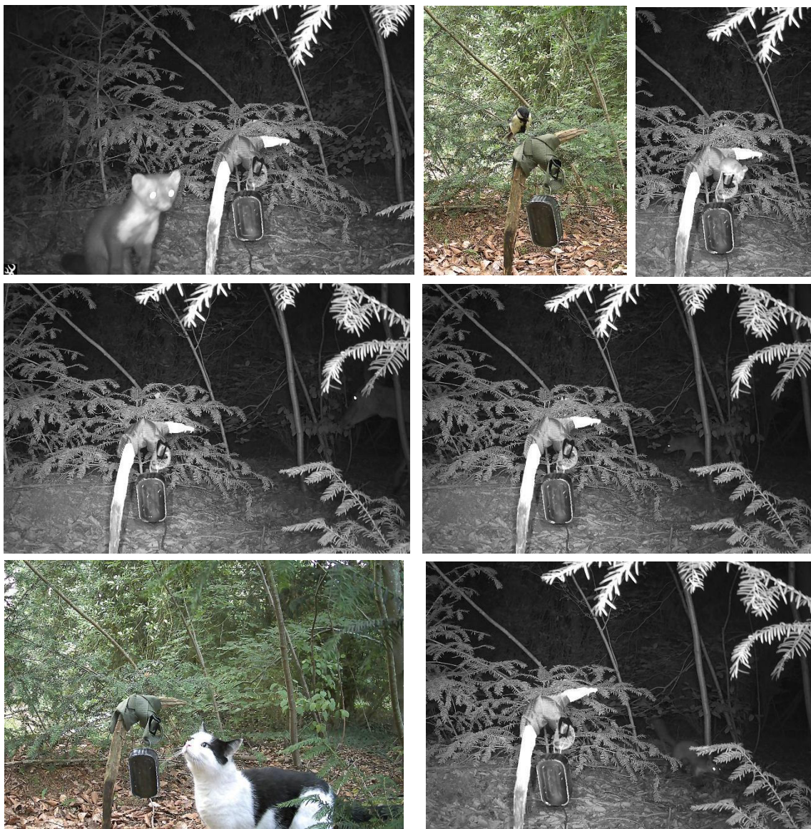
Figuur 5. Enkele vastgelegde beelden