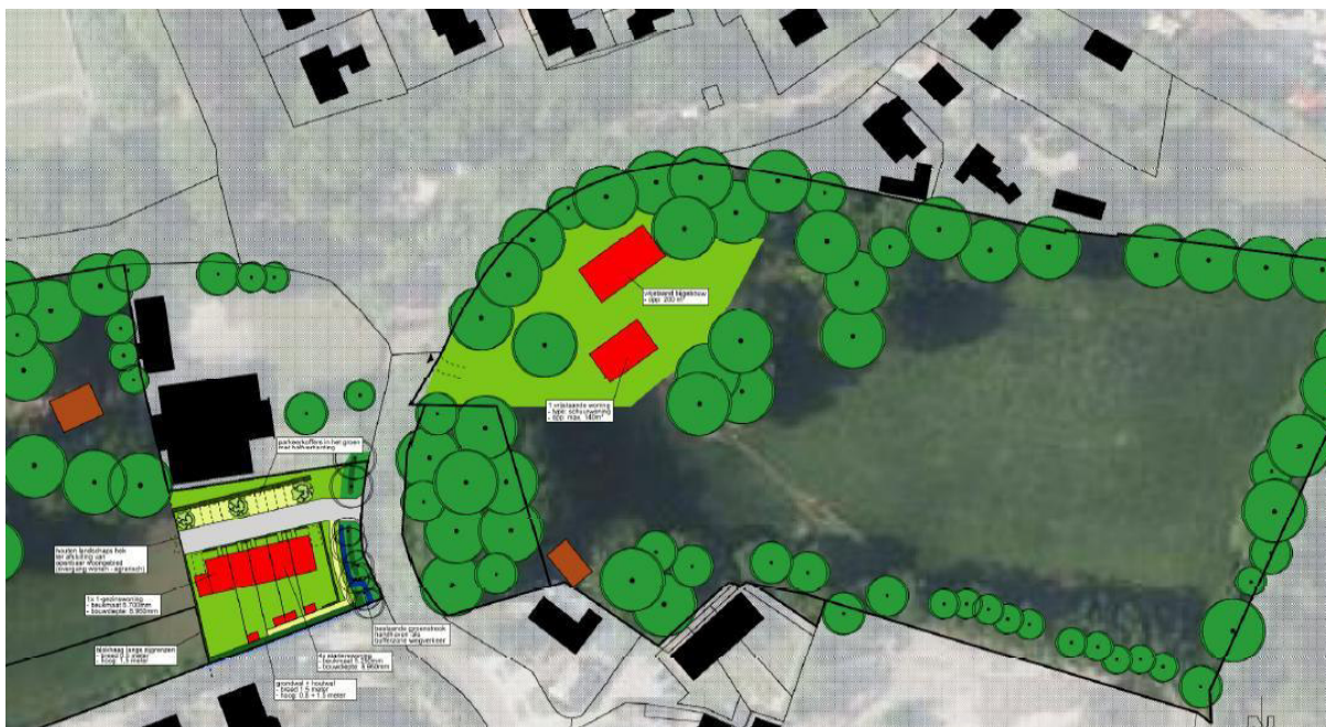
Figuur 2. Inrichting planlocatie

Initiatiefnemer is voornemens om op de planlocatie zes woningen te realiseren op twee percelen (figuur 2). Op de plek van de voormalige boerderij aan de oostzijde van de Elspeterbosweg zal een nieuwe vrijstaande woning met bijgebouw worden gerealiseerd. Aan de westzijde van de Elspeterbosweg zal naast het dorpsshuis een 5-tal woningen worden gerealiseerd, waarvan 4 starterswoningen en 1 hoekwoning. De initiatiefnemer is voornemens om geen bomen te kappen op de planlocatie. Voor vragen over de ontwerpplannen wordt verwezen naar de initiatiefnemer.