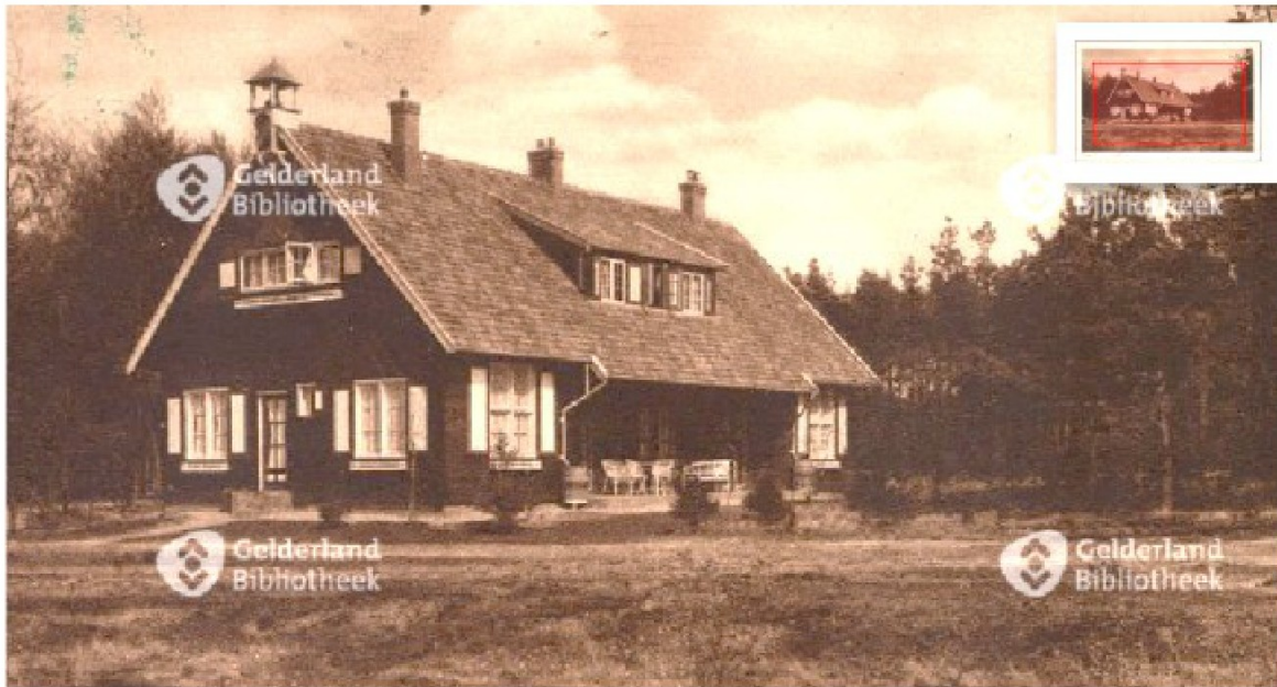
Jachthuis, Apeldoornseweg 89 in Elspeet (jaartal ansichtkaart onbekend)