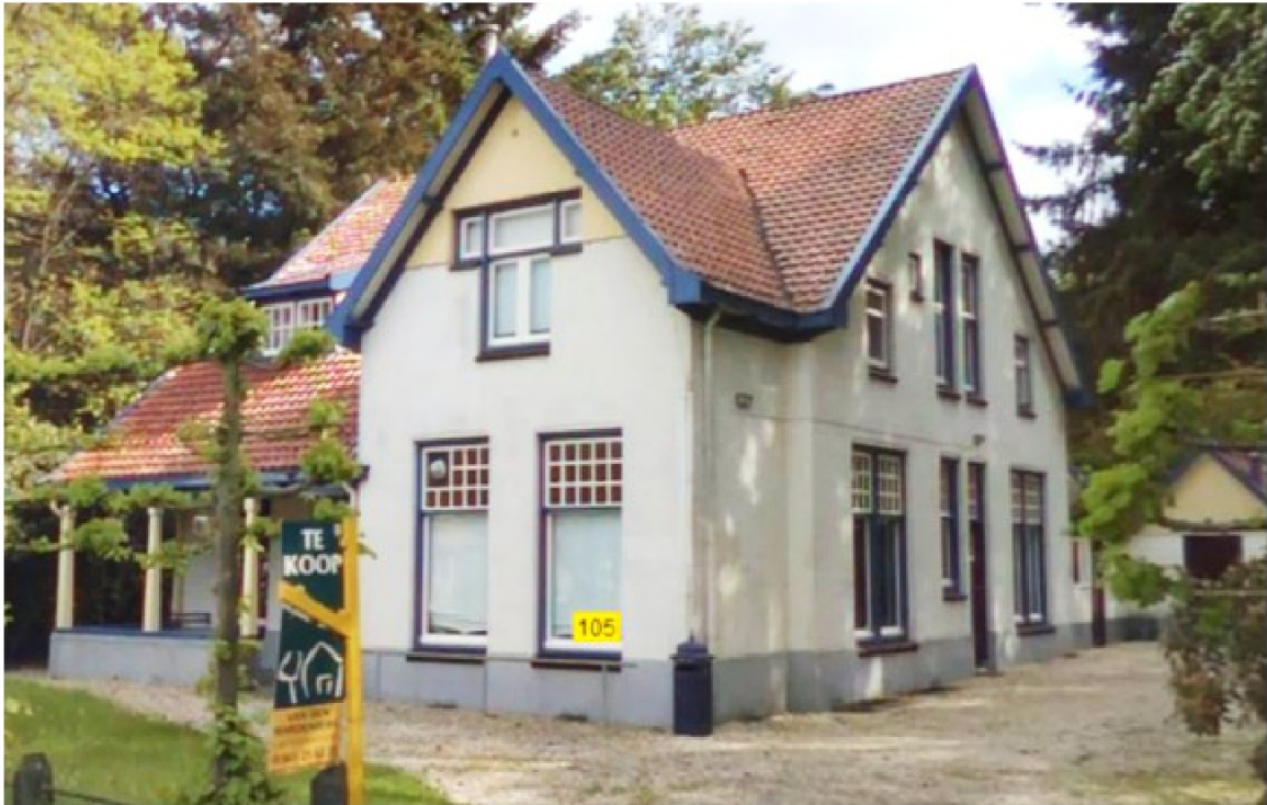
Stavardenseweg 105 in Elspeet (foto uit 2013; het gele nummerbordje is gegenereerd in het fotoprogramma)