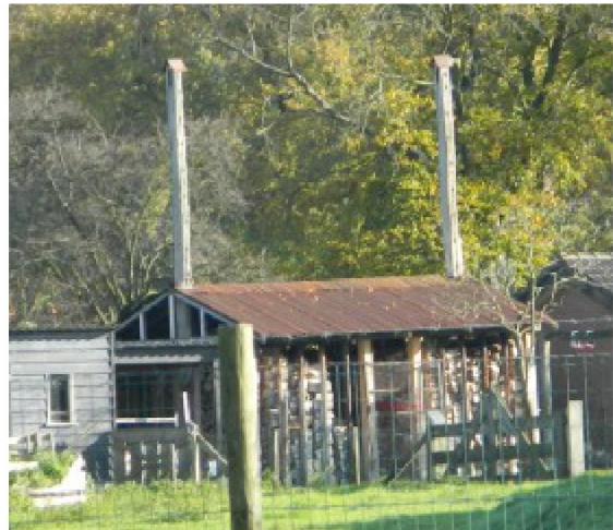
Twee hooibergen, links bijna vergaan, rechts functionerend als houtopslag